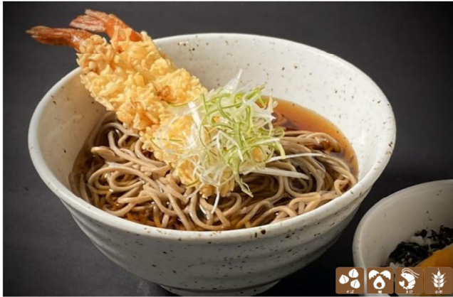
朝から海老天そば(ミニ御飯付) Tempura soba