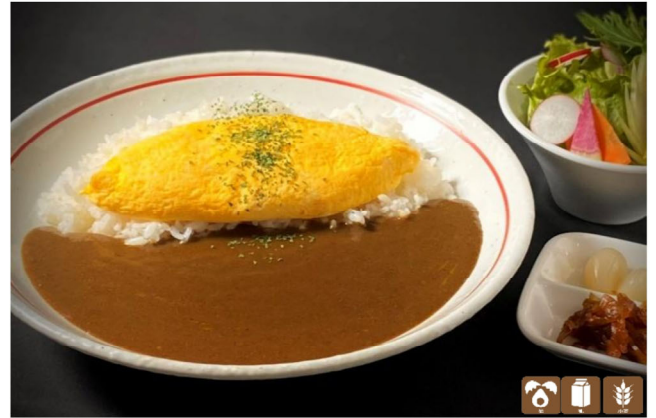
朝からオムレツカレー (サラダ付) Omelet Curry (with salad)