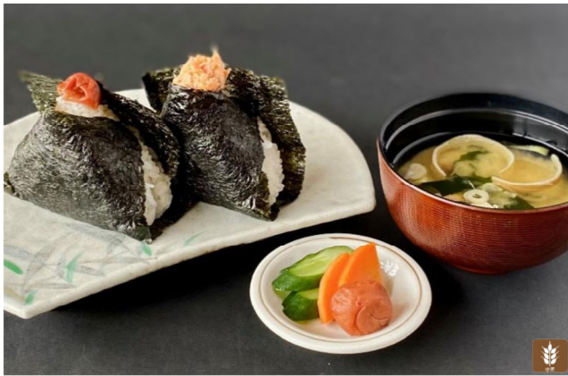
おにぎりセット おにぎり二種/香の物/味噌汁付 Onigiri set (With Onigiri 2 kinds / pickles / miso soup)